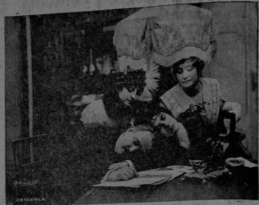
FRANCESCA BERTINI en su producción más reciente